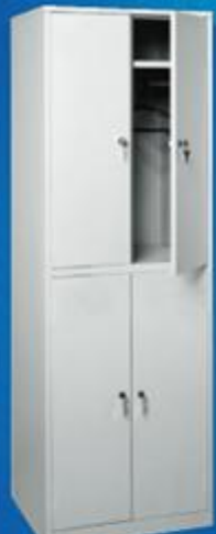
ШО 4 с перекладиной