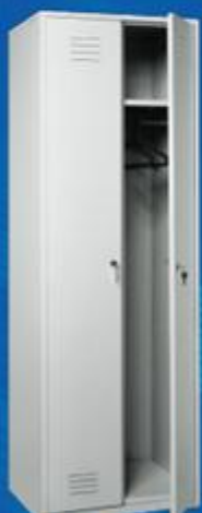
ШО 2 (стандарт, 2 замка EURO LOCKS)