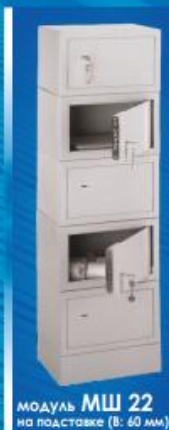
модуль МШ 22 на подставке (В: 60 мм)