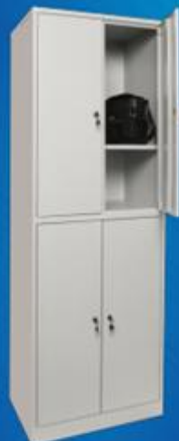
ШО 4 с полкой (стандарт)