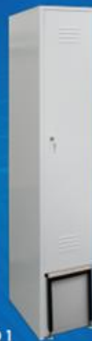
ШО 1 с выдвижной скамейкой