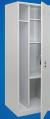
Шкаф для хоз. инвентаря