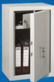
МШ 70 Т