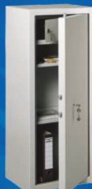
МШ 110 Т