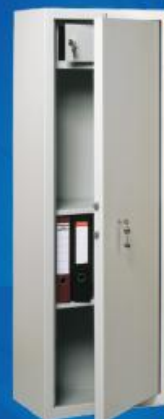
МШ 150 Т