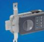
Электронный кодовый замок