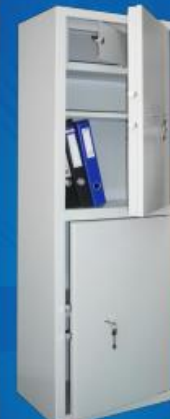
МШ 150/2 Т