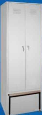
ШО 2 с выдвижной скамейкой