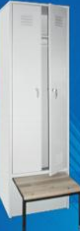
ШО 2 с выдвижной скамейкой