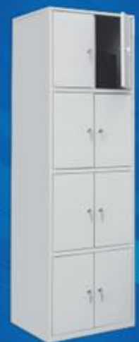
ШО 8 (локер)