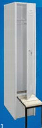
ШО 1 с выдвижной скамейкой