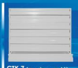
СТК 7 (под формат А1)