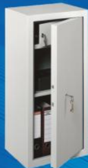
МШ 90 Т