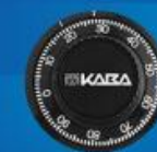
Механический кодовый замок